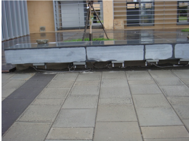
尚未補滿位下空隙，以免有異物進入